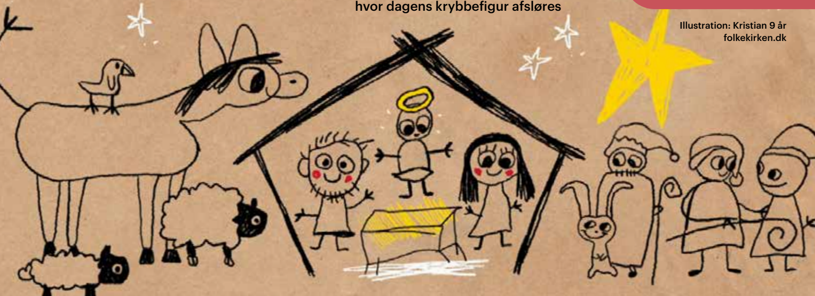
Illustration: Kristian 9 år folkekirken.dk